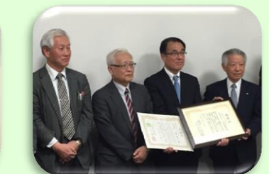
クオカード様より寄付金贈呈