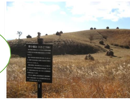
草小積みめの設置と草原文化PR