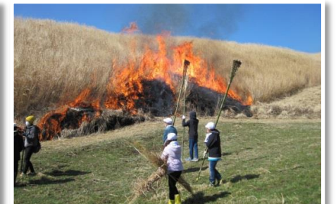
野焼き体験学習の支援