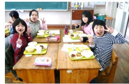
あか牛給食の支援