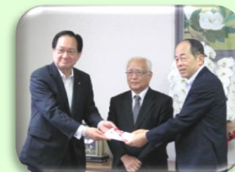
熊本第一信用金庫様より寄付金贈呈