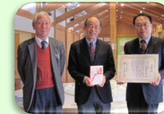
富士ゼロックス熊本端数倶楽部様より寄付金贈呈