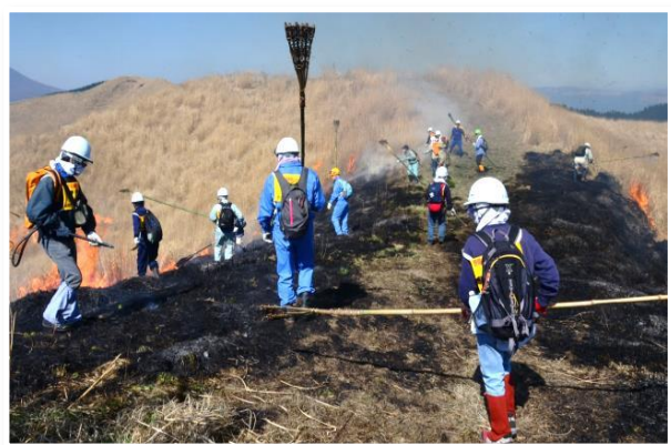
＜野焼き支援ボランティアの派遣＞