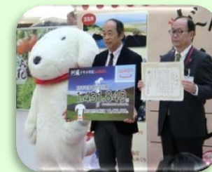
イオン九州様より寄付金贈呈