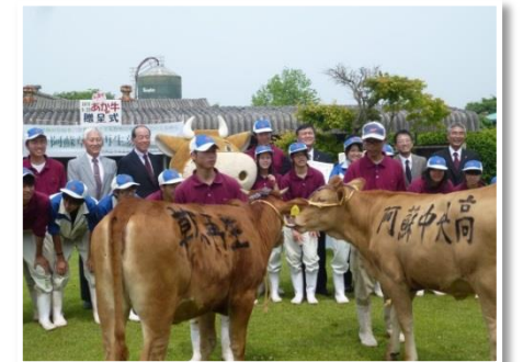
阿蘇中央高校校へのあか牛の寄贈