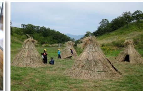
草泊まり学習の支援