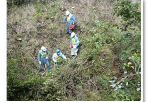
ヤブになっていた雑木の撤去