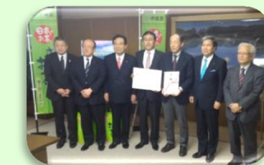
伊藤園様より寄付金贈呈