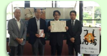
(株)坂本九州すし市場グループ様より寄付金贈呈