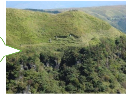
輪地切り（防火帯作り）