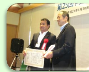
コカ・コーラボトラーズジャパン様より寄付金贈呈